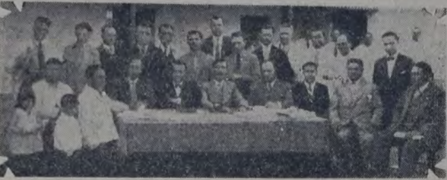
DELEGADOS AL CONGRESO REGIONAL DE LA FRATERNIDAD (SECCIÓN F. C. P.), que se reunió en Laboulaye